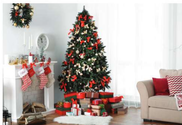
Shutterstock / © Africa Studio, 2016

Mám ještě na výběr jedli vysokou 2 m 85 cm a smrk 2 m 70 cm vysoký. Pomůžete mi vypočítat, který vánoční strom mohu koupit?